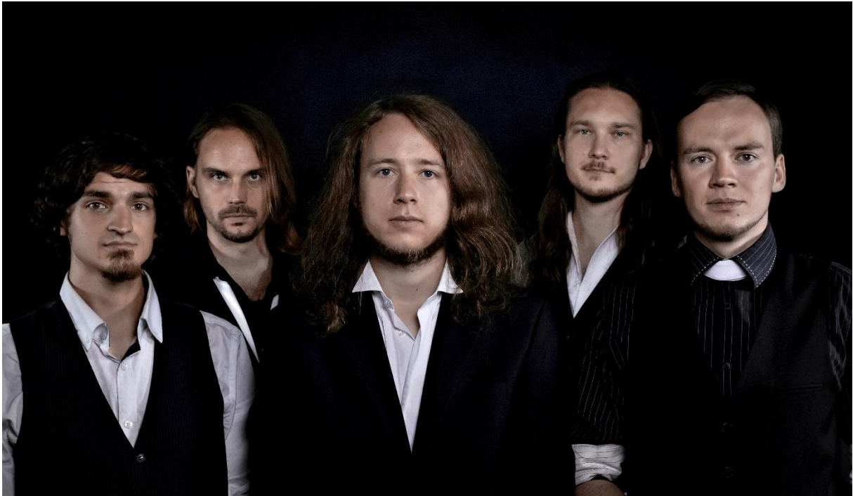
Abbildung 5: Besetzung seit 2017

„Große Linien und harte Grooves“ - NWZ Events