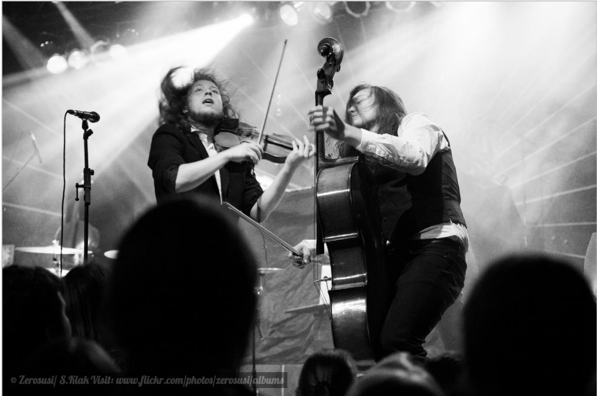
Abbildung 2: Live als Vorband zu Coppelius, 2016