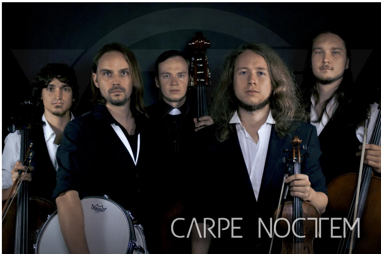
Abbildung 3: Neue Besetzung, 2017

Nach dem Abschluss des Albumprojekts „Schattensaiten“, Ende 2016 hat sich das Ensemble zum Teil neu aufgestellt. Die neuen Ideen und Gesichter ergänzen das gewachsene Image der Band sehr organisch.