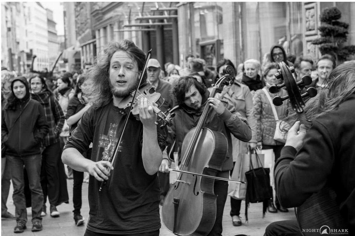
Abbildung 4: Auf der Straße, Braunschweig 2016

Das Bildmaterial kann direkt aus der PDF kopiert werden: praxistipps.chip.de/bilder-aus-pdf-herauskopieren-so-gehts 12831. Falls das nicht funktionieren sollte, die Auflösung nicht genügt oder die Vektordateien des Logos gewünscht sind: gern einfach mailen!