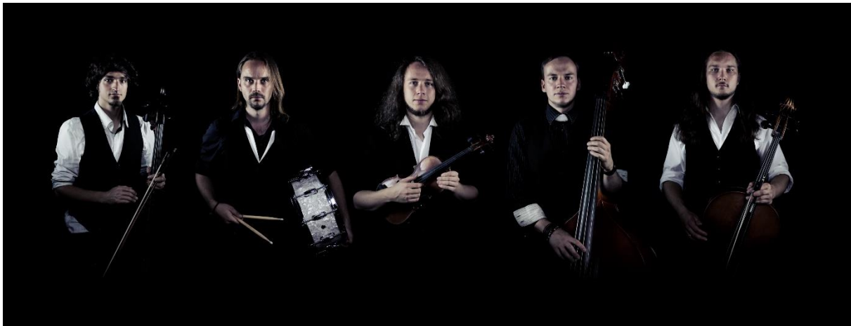
Abbildung 1: CARPE NOCTEM mit Instrumenten

Furios - Instrumental - Energiegeladen. Eine Symbiose aus klassischer Virtuosität, atmosphärischen Klangwelten und Metal-eigener Kraft verbindet Violine und Cello mit Schlagzeug und Bass. Auf ihren Konzerten begegnen sich Headbanger und Philharmoniker, um das Quintett in grenzenloser Spielfreude, bei der scheinbar schier schrankenlosen Zerstörung ihrer Bogenbespannung zu erleben. CARPE NOCTEM.